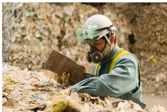
金属スクラップの徹底した分別